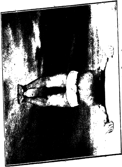
सर्वगाहन ( खुले हाथ )